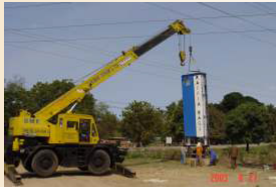
Bango la nguzo kubwa la ukubwa wa 7mx2mx0.6m likisimikwa kwenye kitako cha zege ambacho pia kimetengenezwa nasi.