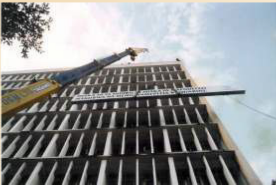
Bango la "flexy" la futi za mraba 160 likisimikwa kwenye ghorafa ya tisa kwa kutunia kreni yenye mkono mrefu.