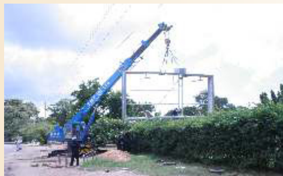
Bango la 6mx3m likisimikwa kwenye kitako cha zege ambacho pia kimetengenezwa nasi.